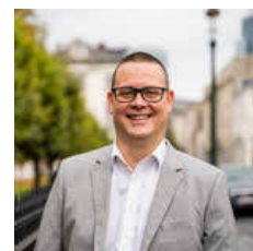
Raoul Hedebouw, Président du PTB

ans, mais notre proposition avait été rejetée. Nous sommes le seul parti qui continue à lutter sans relâche contre la culture du profit qui sévit rue de la Loi. Les ministres gagnent 10 000 euros par mois, alors que beaucoup de gens ont du mal à joindre les deux bouts. C'est pourquoi les dotations des partis et les salaires des ministres et députés doivent diminuer de moitié. Nous donnons nous-mêmes l'exemple. Nos élus ont fait le choix de vivre avec le salaire moyen d'un travailleur. Chez nous, pas de profiteurs.